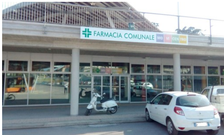
L'ingresso della farmacia comunale al Movicentro

E' di ieri la sentenza che respinge il ricorso presentato da Federfarma contro il pronunciamento del Tar di fine giugno 2016