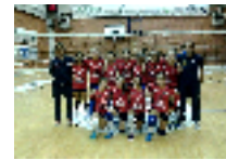
Volley giovanile: terza vittoria consecutiva per Lpm Farmacia del Santuario...