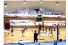
Lpm Farmacia del Santuario vincente sulla Bre Banca Mercato Cuneo