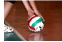
Il girone di andata si chiude con una vittoria per l'LPM Farmacia del Santu...